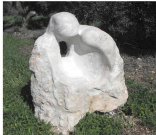
אבן בר טבעית, גיר 50x130x150cm