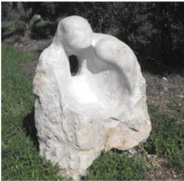
אבן בר טבעית, גיר 50x130x150cm