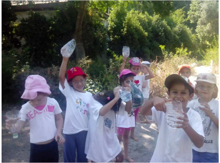
ילדי בית תות בפעילויות בחופש הגדול- משחק "למלא את הדלי"